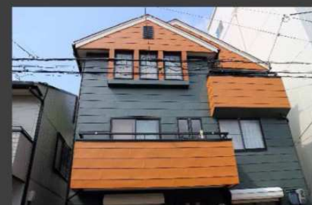
M邸(神戸市) カラーGL (2色)