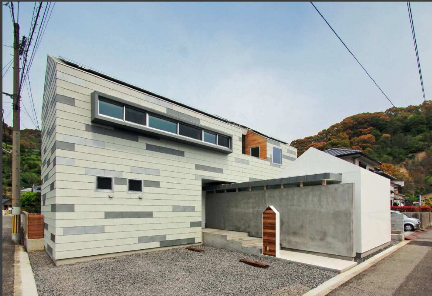
nico(松山市) 耐磨カラーGL A型 (3色ランダム葺き)