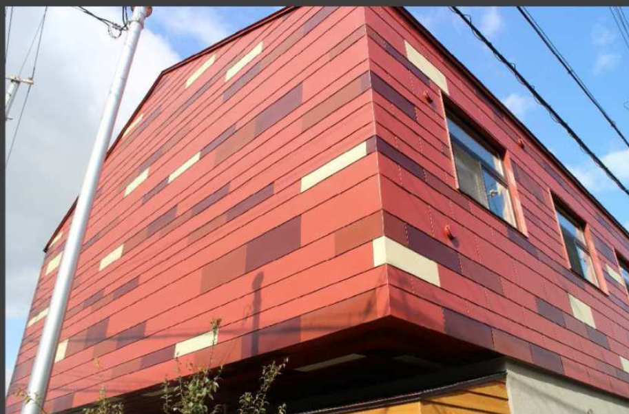
金田幼稚園(大阪府) 耐磨カラーGL B型/Cs型/特注幅 (4色ランダム葺き)