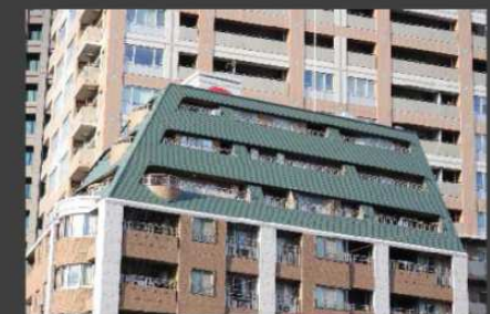
某マンション(改修工事)