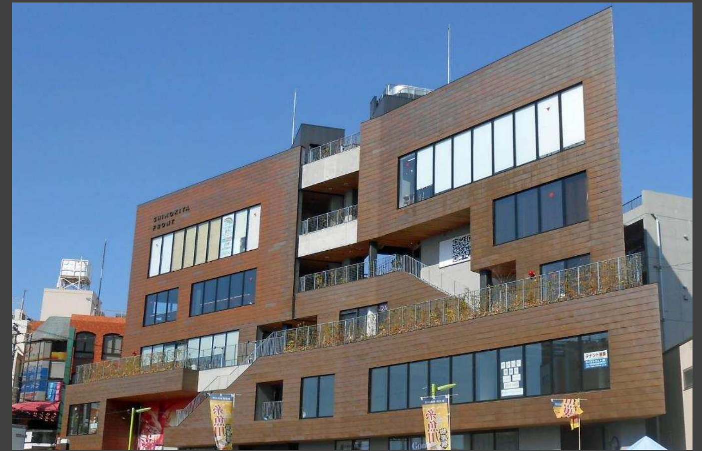
某テナントビル 銅板