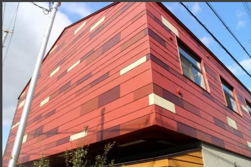
金田幼稚園(大阪府) 耐摩カラーGL B型/Cs型/特注幅 (4色ランダム葺き)

一コマタイプで取り付けは一人作業ができ、窓や開口部などの切欠きや加工も対応しやすい長さです。