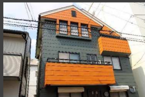
M邸(神戸市) カラーGL (2色)