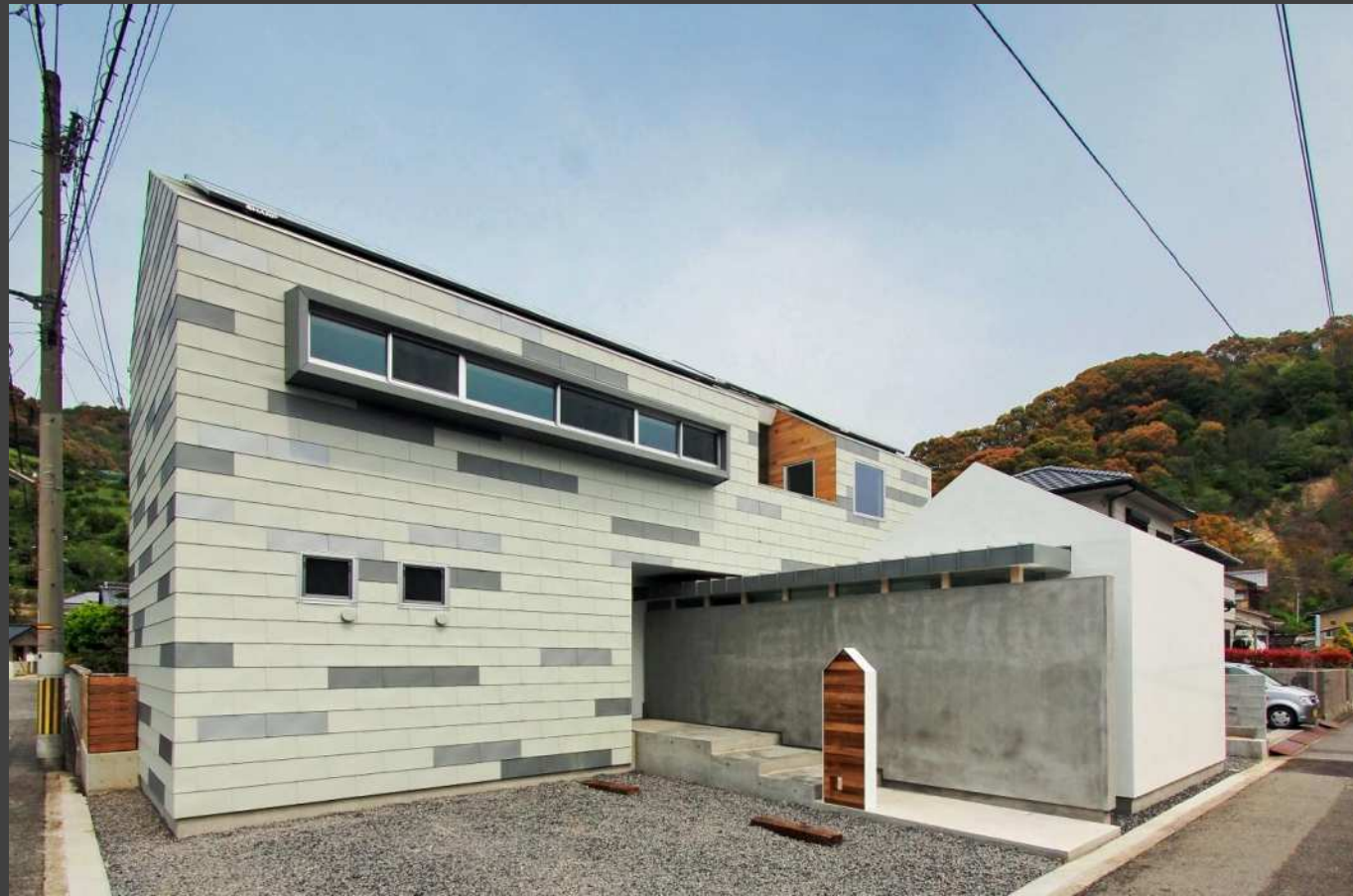
nico(松山市) 耐摩カラーGL A型 (3色ランダム葺き)