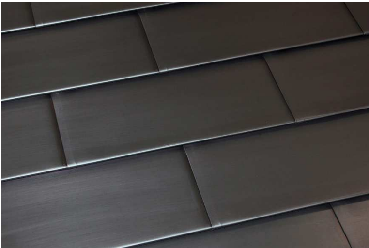
硫化加工について